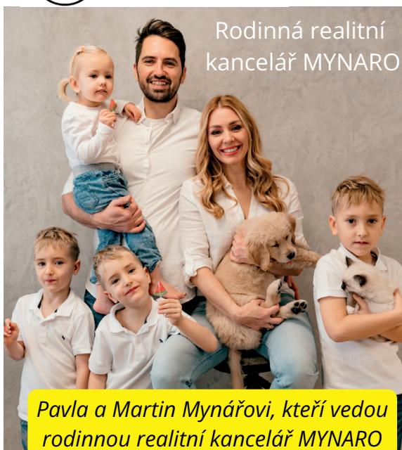
Rodinná realitní kancelář MYNARO

Pavla: Pro ty, kteří se nechtějí pronájmem zabývat, nabízíme službu "Správa pronájmu". Hlídáme pravidelné platby, řešíme veškerou agendu a také požadavky od nájemců. Majitel nemovitosti tedy pronajímá ale absolutně bez starostí. O tuto službu je čím dál větší zájem. Více na www.mynaro.cz