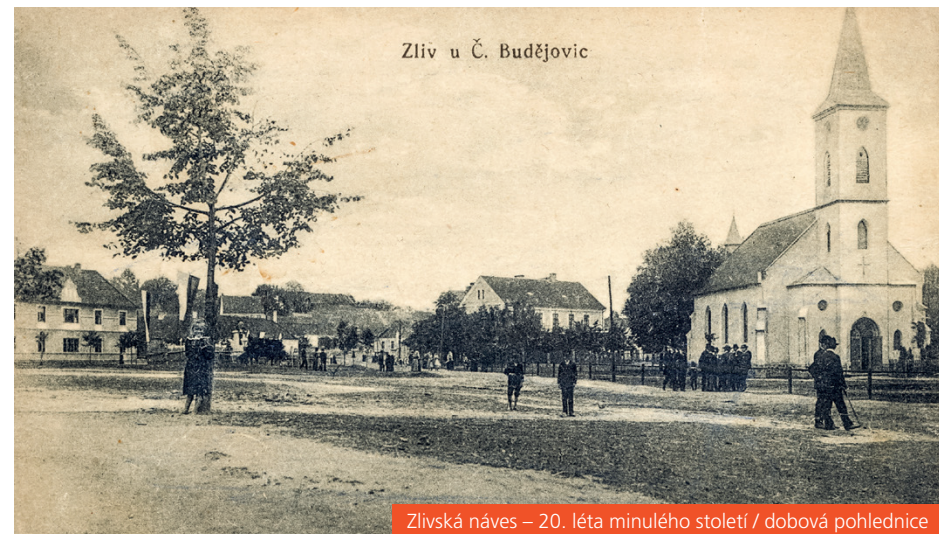
Zlivská náves – 20. léta minulého století / dobová pohlednice

Iva Kučerová, kronikářka Zlivi