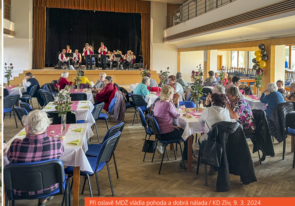
Při oslavě MDŽ vládla pohoda a dobrá nálada / KD Zliv, 9. 3. 2024