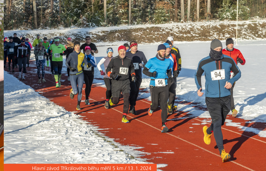
Hlavní závod Tříkrálového běhu měřil 5 km / 13. 1. 2024