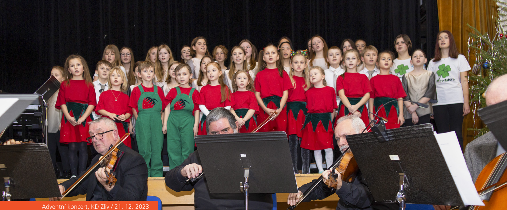
Adventní koncert, KD Zlív / 21. 12. 2023