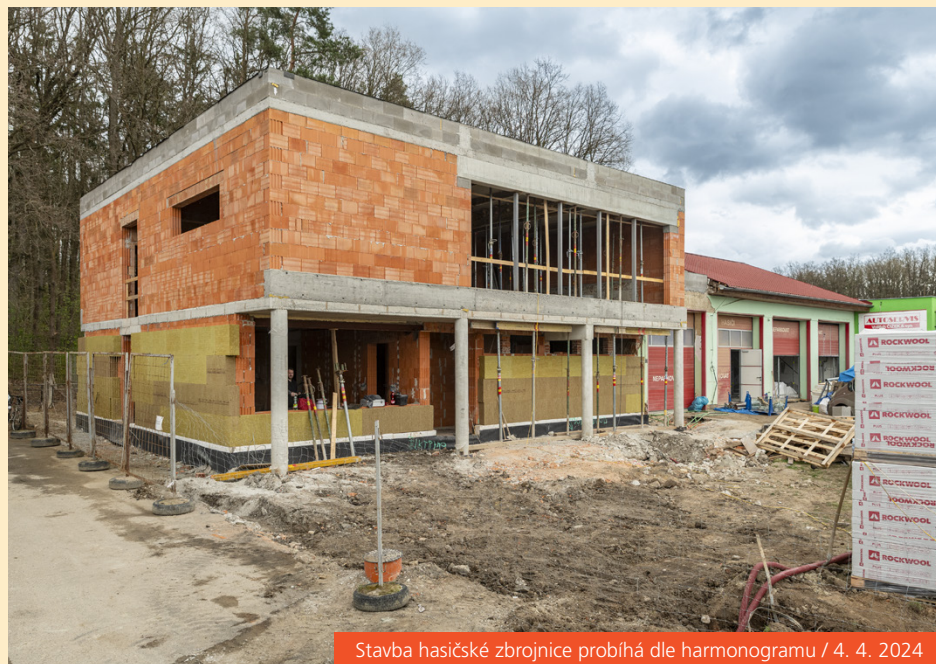
Stavba hasičské zbrojnice probíhá dle harmonogramu / 4. 4. 2024