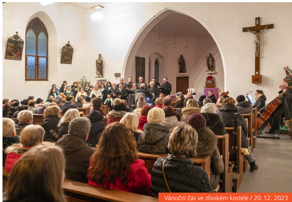
Vánoční čas ve zlivském kostele / 20. 12. 2023