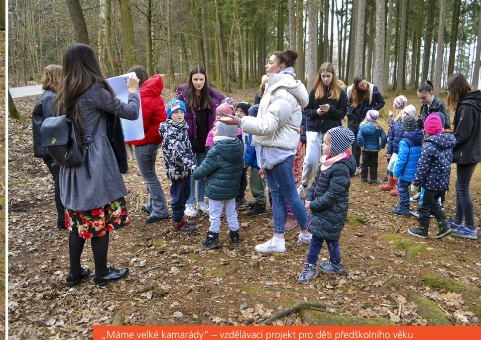
„Máme velké kamarády“ – vzdělávací projekt pro děti předškolního věku