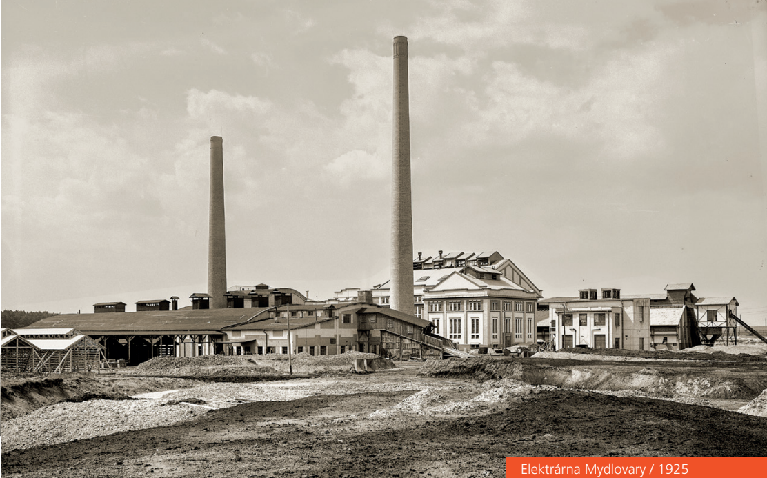
Elektrárna Mydlovary / 1925