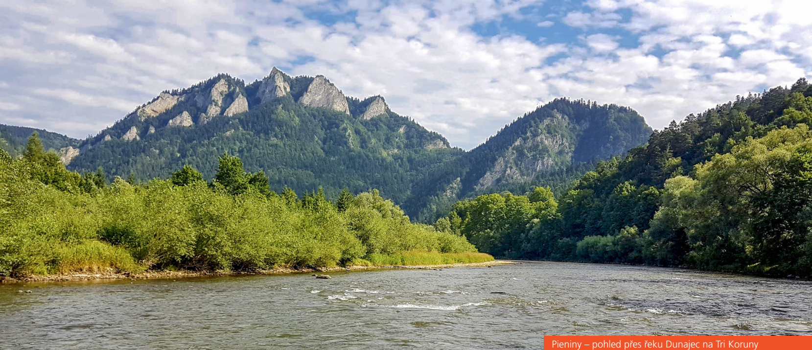
Pieniny – pohled přes řeku Dunajec na Tri Koruny