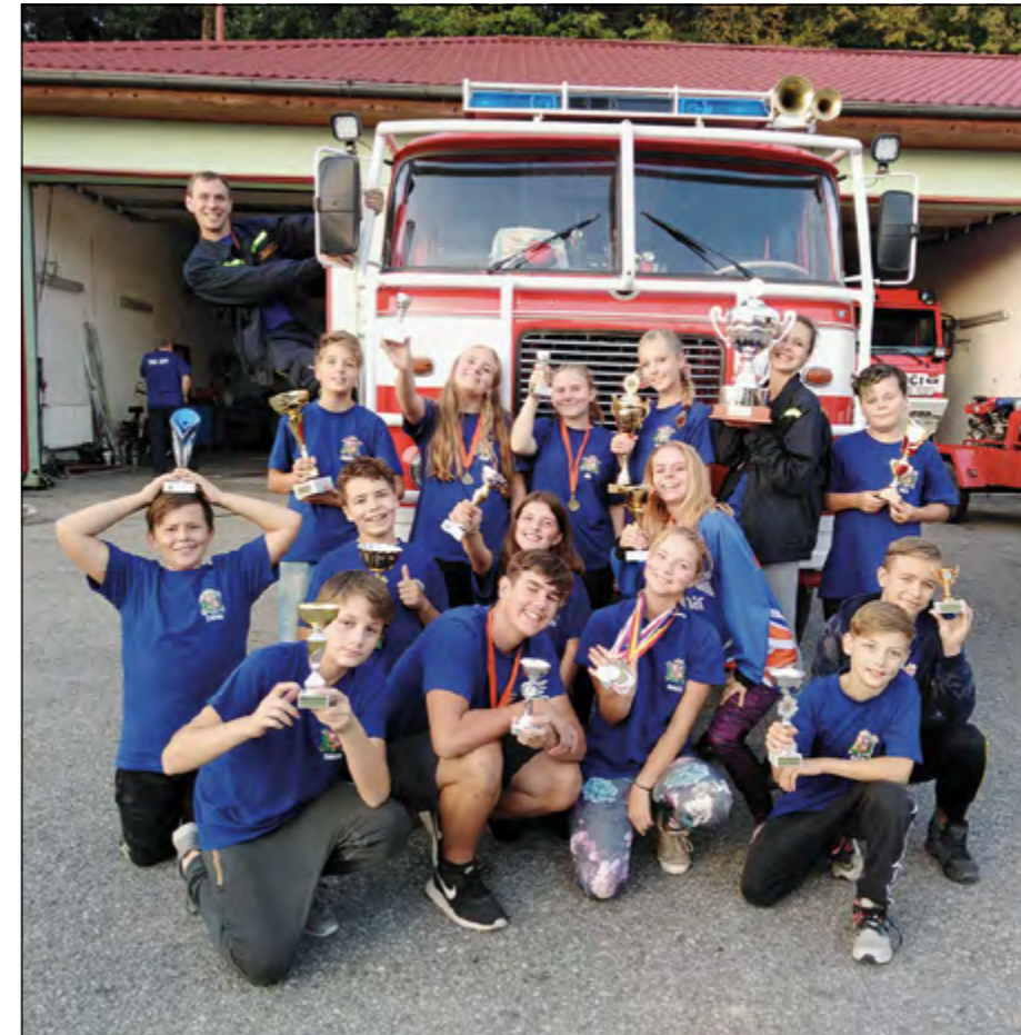
VÍTĚZOVÉ ČESKOBUDĚJOVICKÉHO DVOJBOJE PRO ROK 2018 - SDH ZLIV

Naším posledním cílem sezóny se stal Českobudějovický dvojboj, což je seriál 9 soutěží, na kterých mladí hasiči plní vždy požární útok a jednu další disciplínu ze HRY PLAMEN. Jelikož jsme skromní, slíbili jsme si, že chceme v tomto dvojboji alespoň jedenkrát z 9 závodů přivést medaile. Vědět to na začátku sezóny, dali bychom si cíle mnohem vyšší. Celé léto se nám dařilo a medaile střídala medaile, jak u mladších žáků, tak u žáků starších.