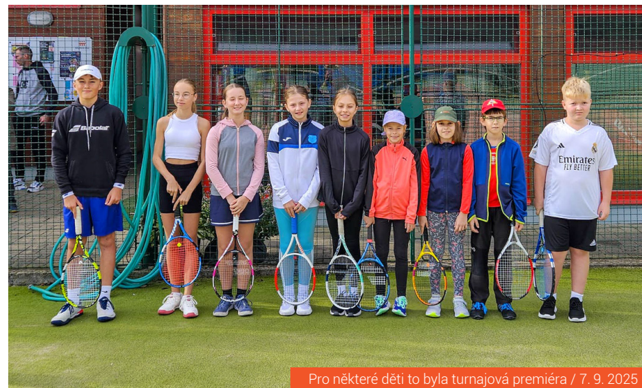
Pro některé děti to byla turnajová premiéra / 7. 9. 2025