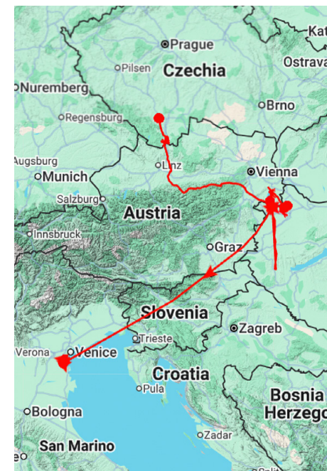
Trasa břehouše černoocasého vypuštěného 1. 7. na rybníce Dehtář (České Budějovice).

foto: Monika Tesařová / vylíhlý břehouš černoocasý Martin Sládeček / vypuštěný břehouš černoocasý