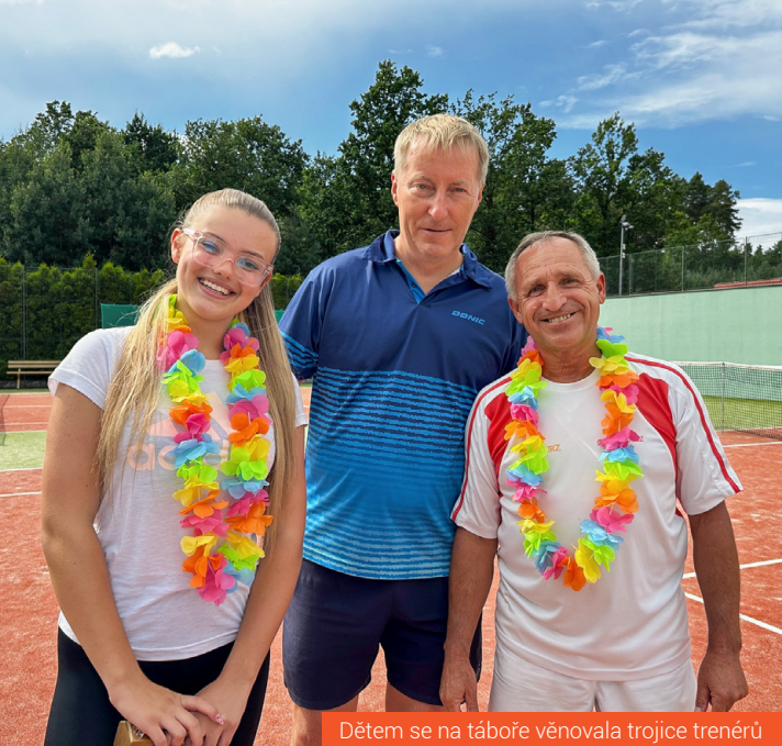
Dětem se na táboře věnovala trojice trenérů