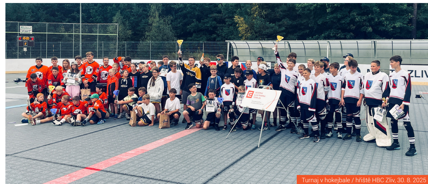
Turnaj v hokejbale / hřiště HBC Zlív, 30. 8. 2025

Traumaplan (traumatologický havarijní plán) je dokument, který slouží ke zvládnutí mimořádných událostí, jako jsou hromadná neštěstí nebo katastrofy, a zajišťuje organizaci první pomoci a následné zdravotní péče.