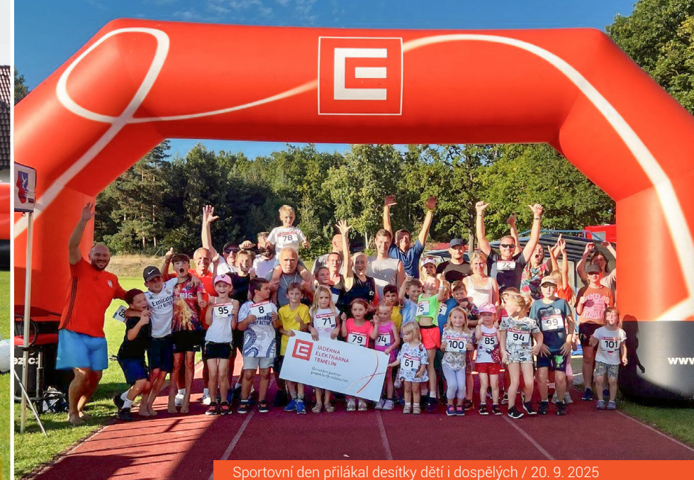
Sportovní den přilákal desítky dětí i dospělých / 20. 9. 2025