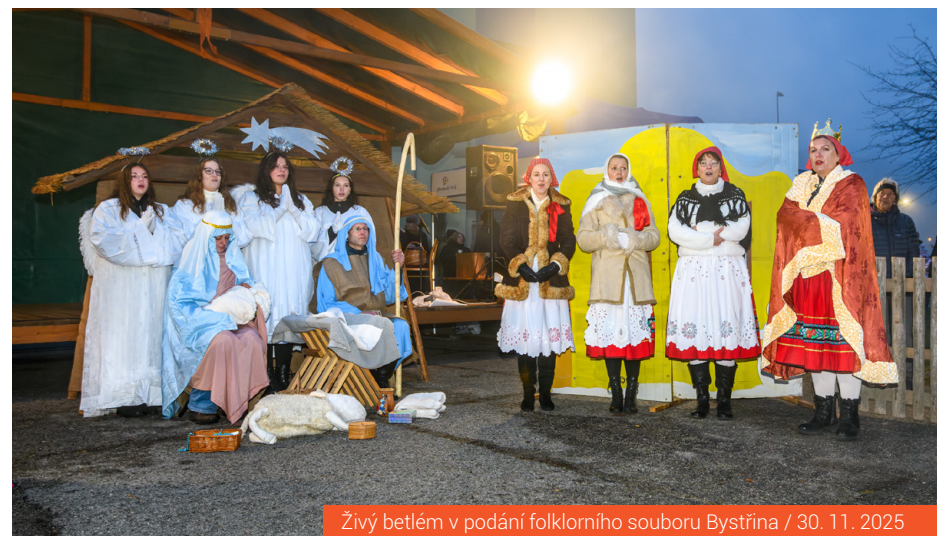
Živý betlém v podání folklorního souboru Bystřina / 30. 11. 2025

Návštěvníci si během programu mohli zakoupit teplé nápoje na zahřátí – punč,