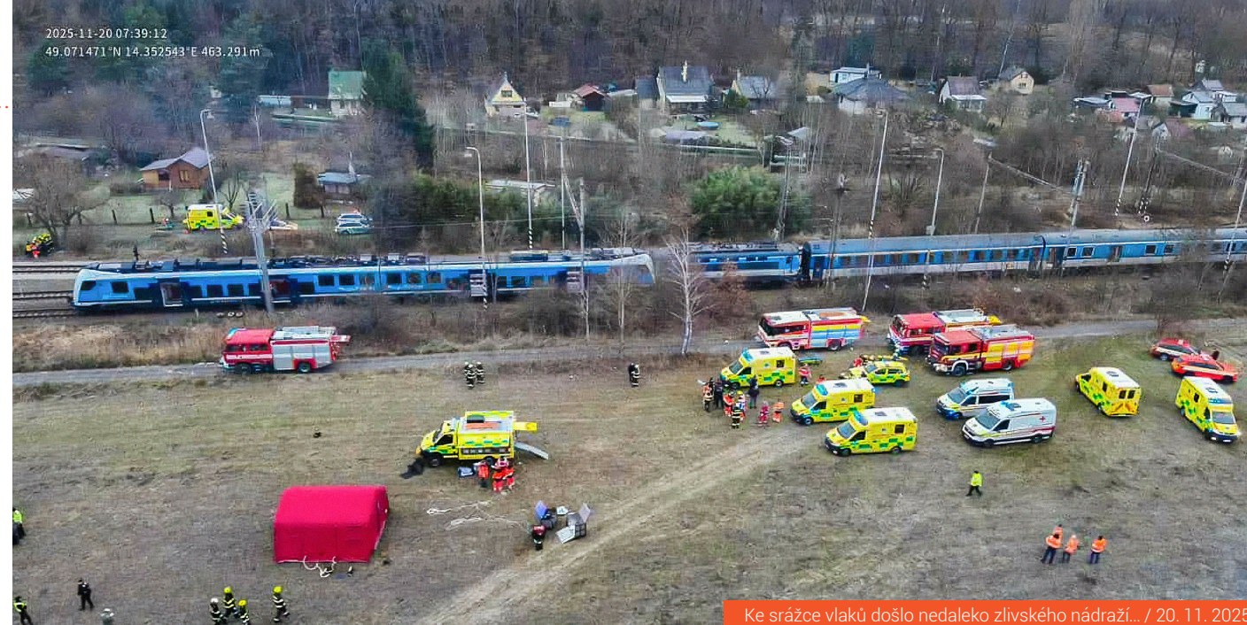
Ke srážce vlaků došlo nedaleko zlivského nádraží... / 20. 11. 2025