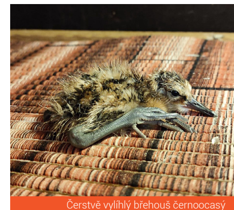
Čerstvě vylíhlý břehouš černoocasý

Nekrmivá mláďata, jako je břehouš, mají velký potenciál pro návrat do volné přírody – schopnost sběru potravy i instinkt pro migraci mají hluboce zakódované. A tak byl mladý břehouš 1. července vypuštěn na rybník Dehtář, kde se v té době zdržovalo větší množství mokřadních ptáků. Na rybníce byl po vypuštění několikrát pozorován a bylo zřejmé, že se dobře adaptoval a dokáže si sám obstarávat potravu.