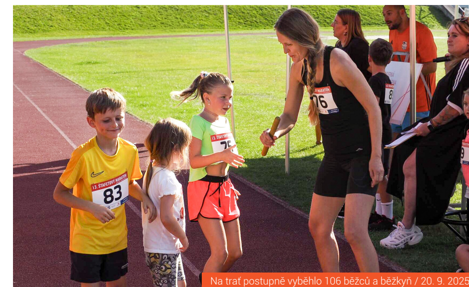
Na trat' postupně vyběhlo 106 běžců a běžkyň / 20. 9. 2025