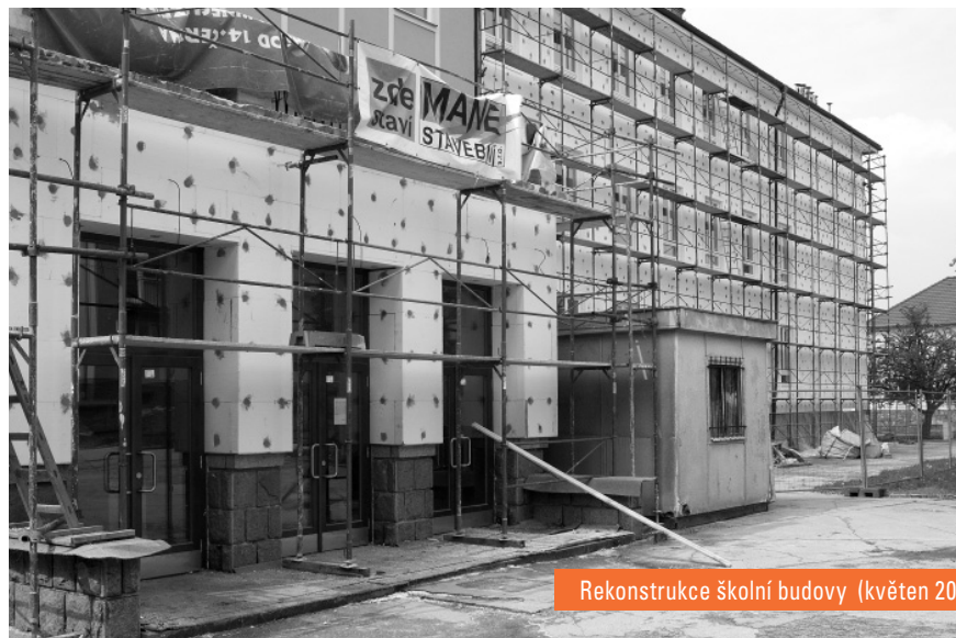
Rekonstrukce školní budovy (květen 2008)

Tato akce byla vložena mezi uvedené akce v průběhu roku. S ohledem na potřeby vaření byla termínově realizována především v období letních prázdnin. Jednalo se o kompletní technologické vybavení kuchyně, kterému předcházela