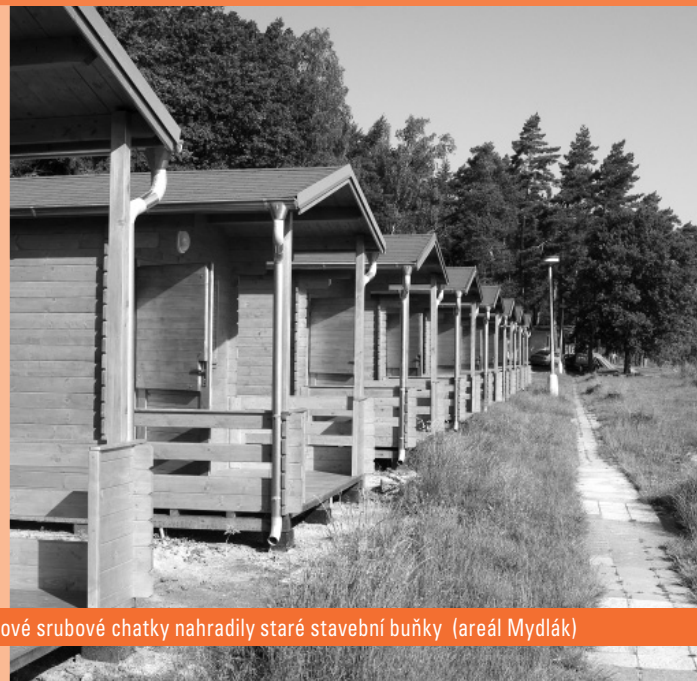
Nové srubové chatky nahradily staré stavební buňky (areál Mydlák)