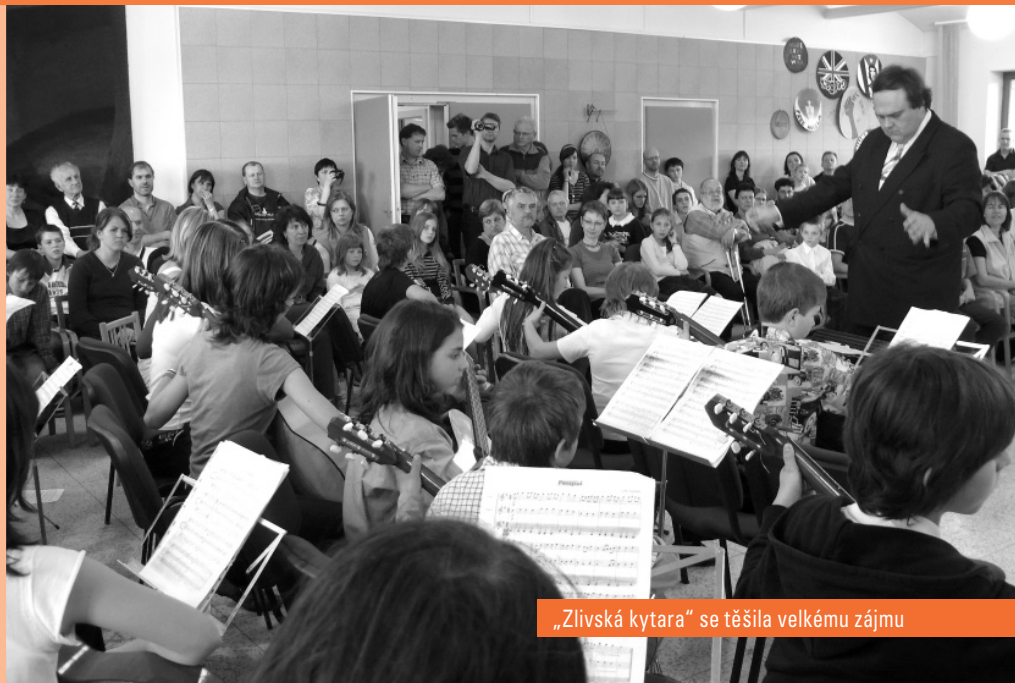
„Zlivská kytara“ se těšila velkému zájmu