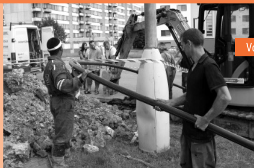
Vododní řad se dočkal výměny (červen 2008)