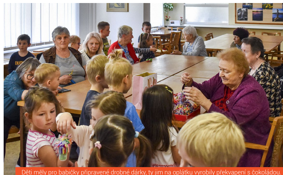
Děti měly pro babičky připravené drobné dárky, ty jim na oplátku vyrobily překvapení s čokoládou.