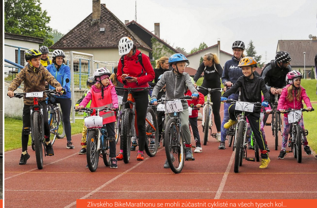
Zlivského BikeMarathonu se mohli zúčastnit cyklisté na všech typech kol...