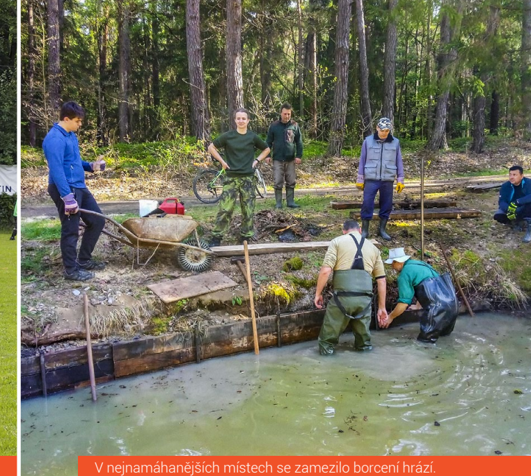
V nejnámáhanějších místech se zamezilo borcení hrází.