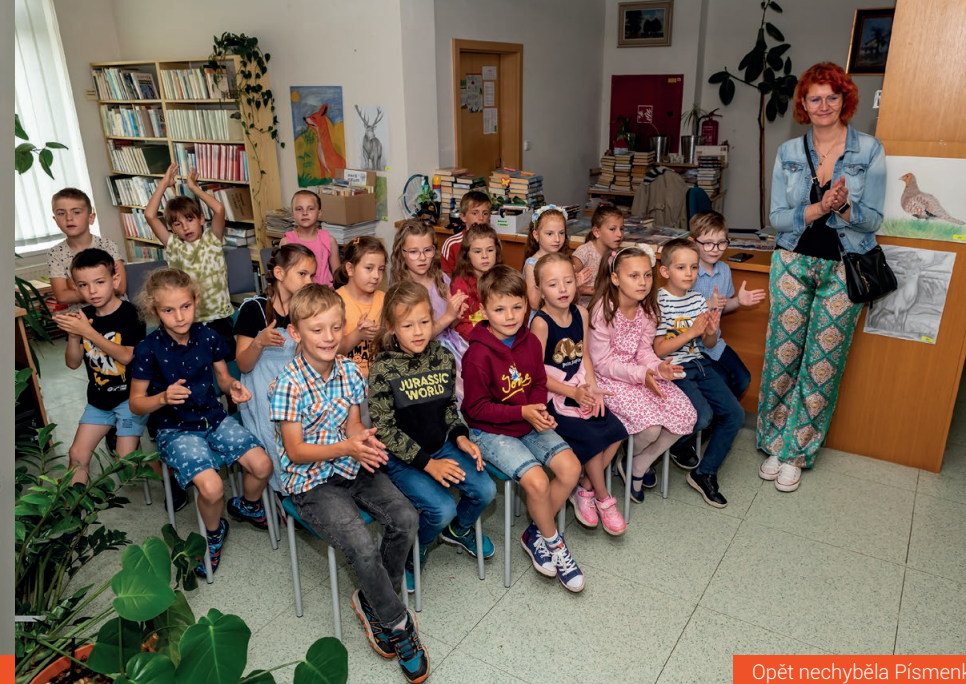
Opět nechyběla Písmenková královna a šikovní prvňáčci... / městská knihovna 11. 6. 2024