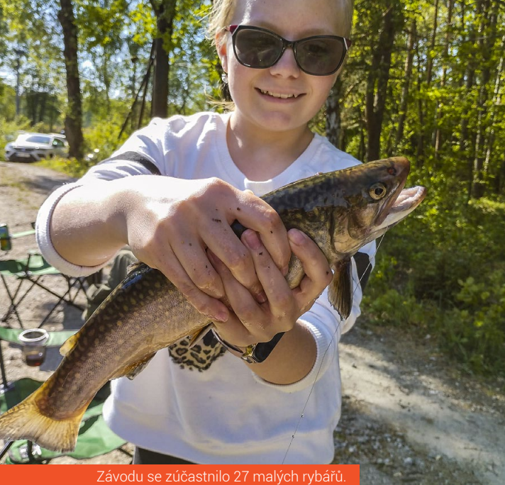
Závodů se zúčastnilo 27 malých rybářů.