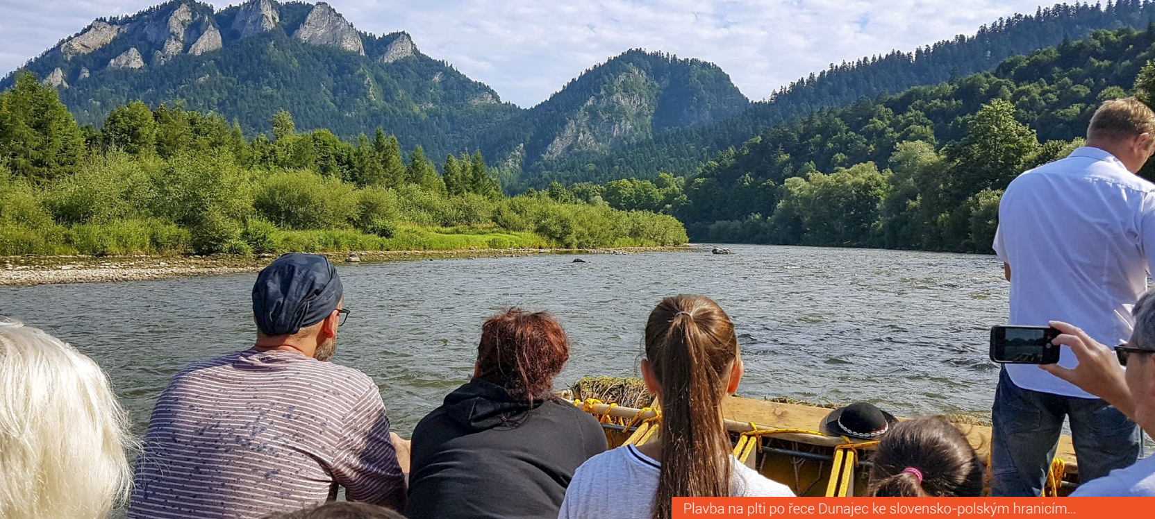
Plavba na plti po řece Dunajec ke slovensko-polským hranicím...