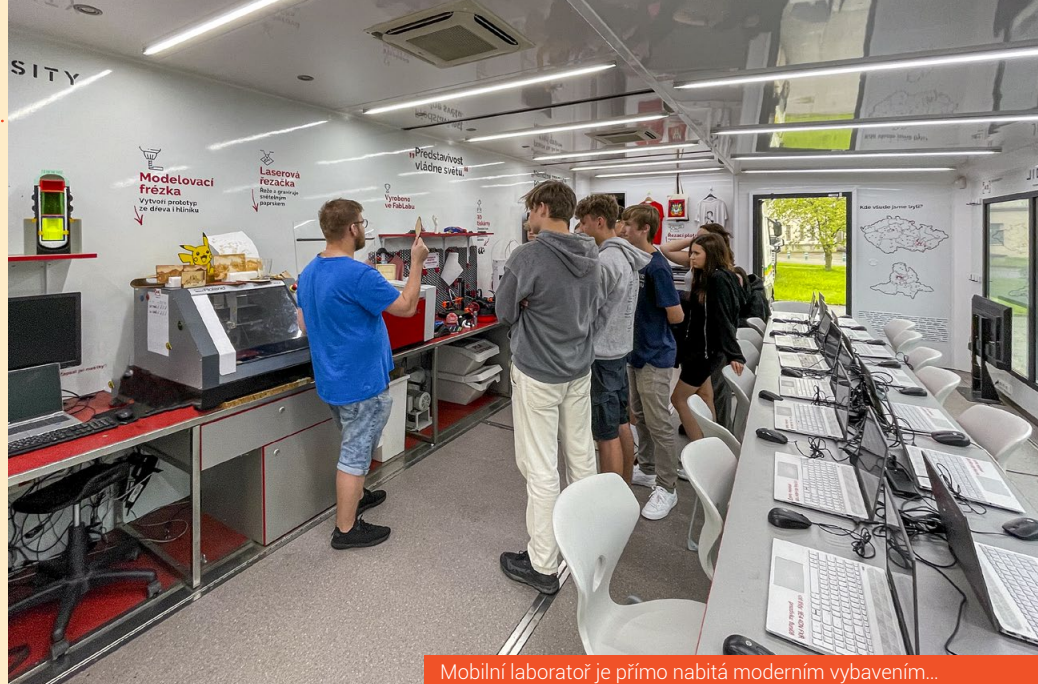
Mobilní laboratoř je přímo nabitá moderním vybavením...

Vpředu je umístěn lanový naviják, na střeše je teleskopický osvětlovací stožár, po bocích je osvětlená nástavba a vzadu je umístěná čerpadlo o výkonu 2000 litrů/min. Při použití vysokotlaké hadice, která je dlouhá 60 m, vyvine tlak až 40 barů.