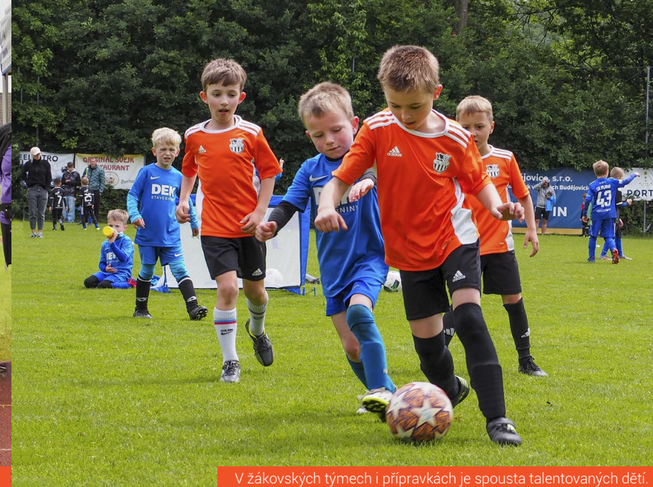
V žákovských týmech i přípravkách je spousta talentovaných dětí.