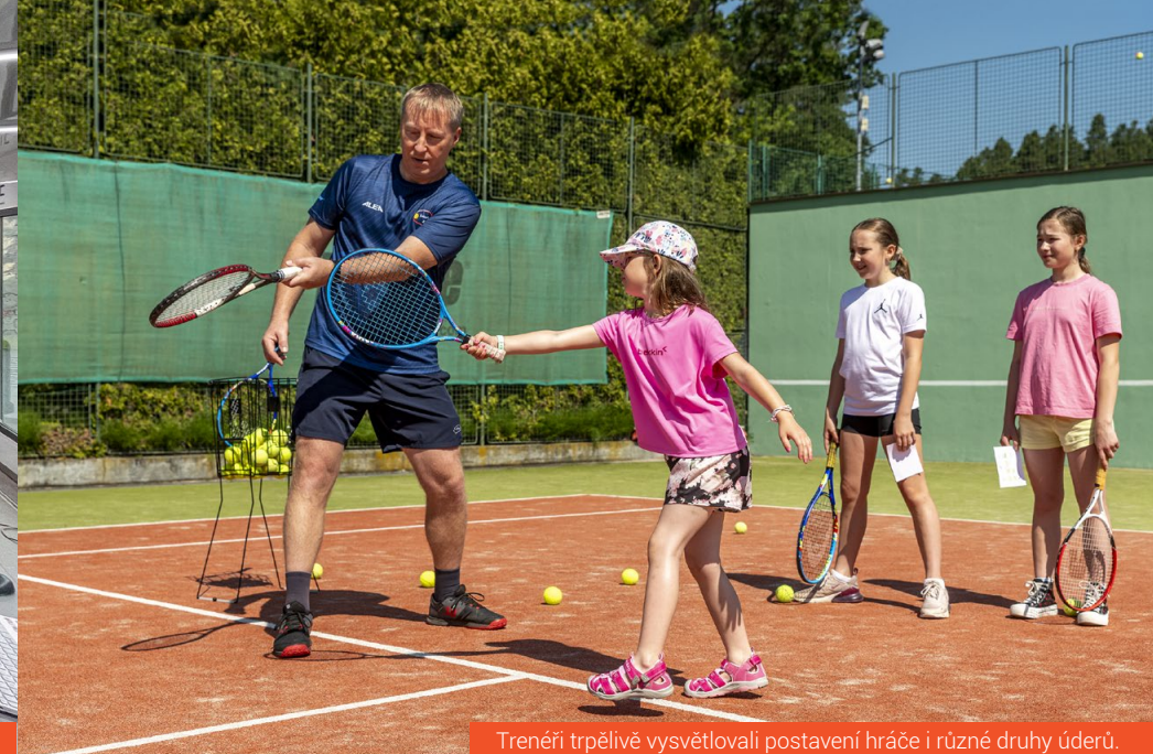
Trenéři trpělivě vysvětlovali postavení hráče i různé druhy úderů.