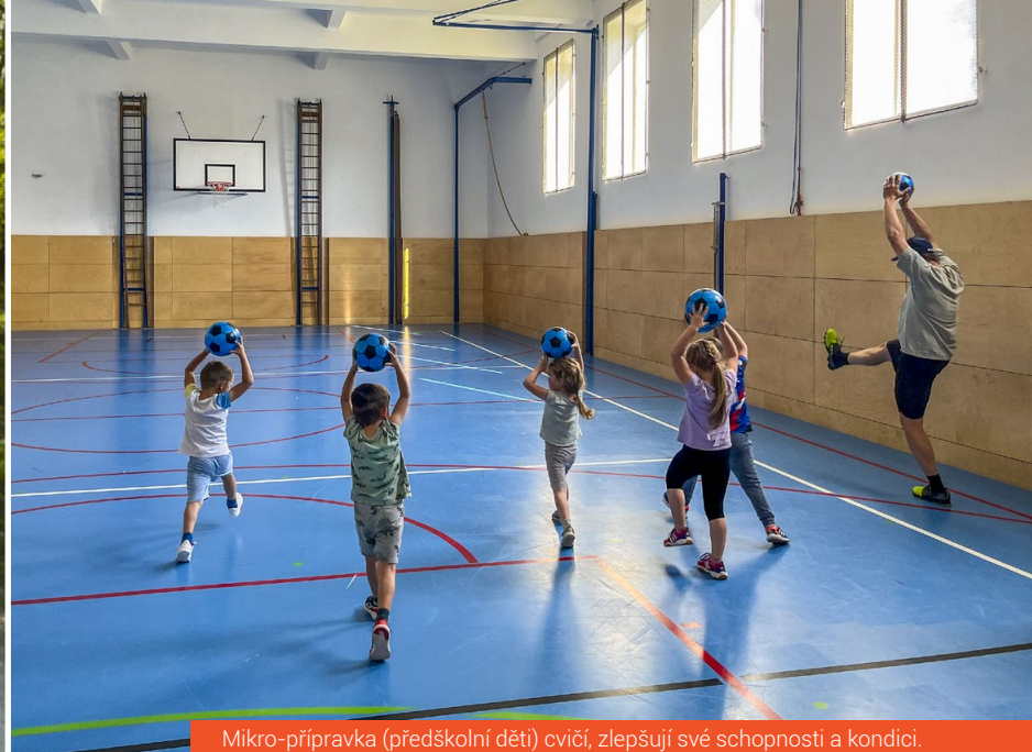
Mikro-přípravka (předškolní děti) cvičí, zlepšují své schopnosti a kondici.

Již tradičně se 1. května 2024 konaly 48. dětské rybářské závody. Počasí dětem přálo, bylo jasno, a i když se občas přihlásil o slovo vítr, nikomu to náladu nekazilo. Závodů se zúčastnilo 27 dětí, nasezeno bylo 200 kusů sivena o hmotnosti 100 kg. Závodníkům se mimo sivenů podařilo chytit i jiné druhy ryb jako např. okouny, perlíny, pár plotic a dokonce i jednu štika. Všichni závodníci byly oceněni a věříme, že jsme si všichni toto krásné odpodílné užili.