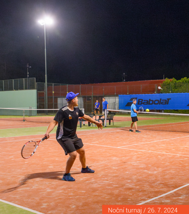
Noční turnaj / 26. 7. 2024