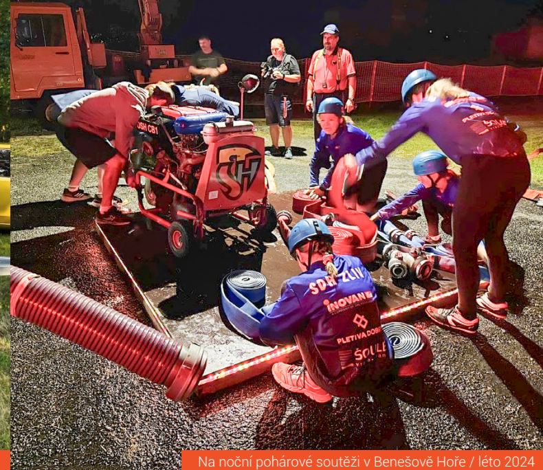
Na noční pohárové soutěži v Benešově Hoře / léto 2024