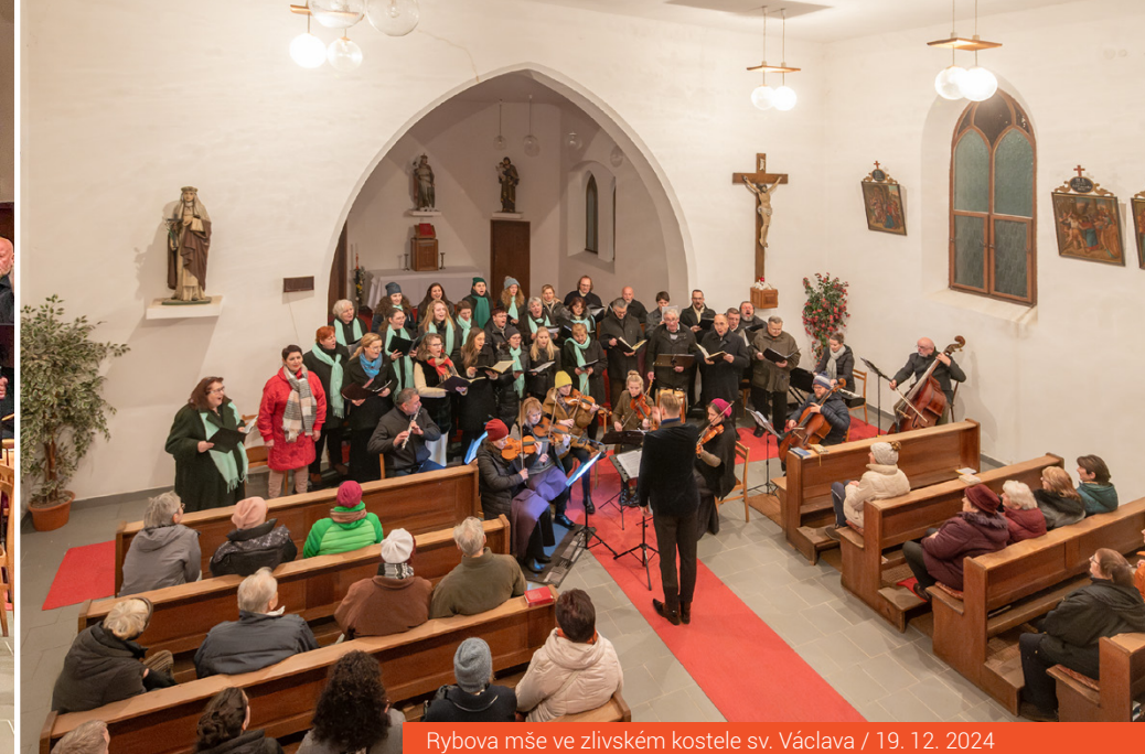
Rybova mše ve zlivském kostele sv. Václava / 19. 12. 2024