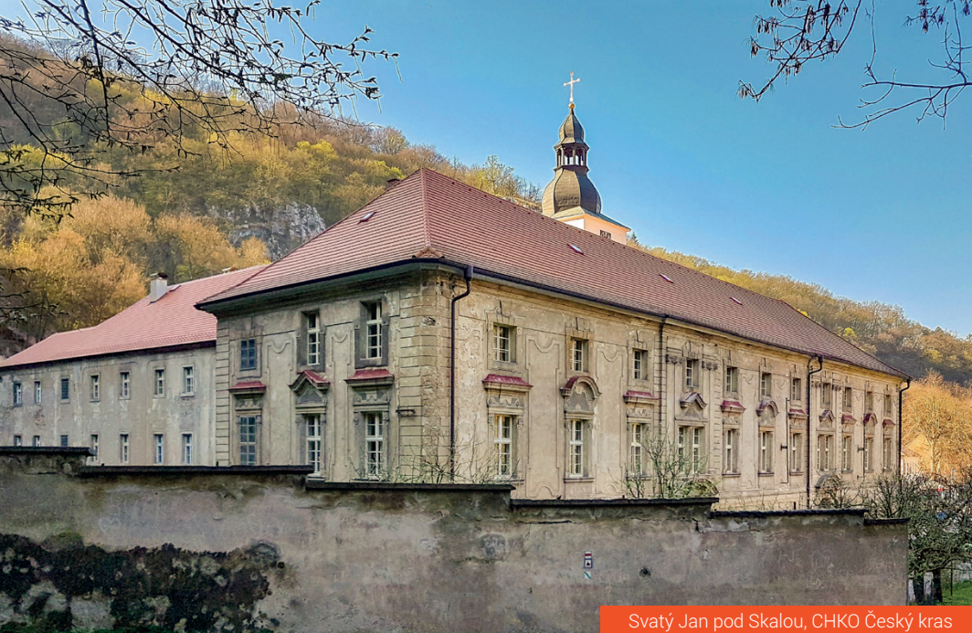
Svatý Jan pod Skalou, CHKO Český kras