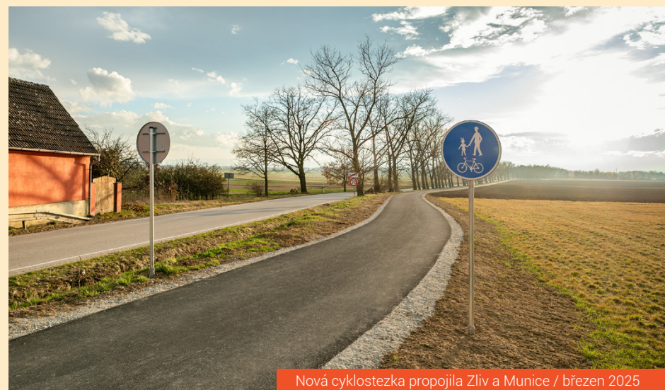
Nová cyklostezka propojila Zliv a Munice / březen 2025

Radek Rothschedl, starosta