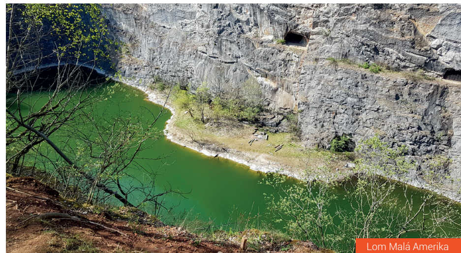
Lom Malá Amerika

Kamarád prohrává boj s hladem a něco loví v bágly. Pravda, moc jsme se nenasnídali. Já s kručením v žaludku jdu zvolna vzhůru. Od kaple Povýšení sv. Kříže se mi otevře první krásný výhled. Ve strmém stoupání postupně odkládáme přebytečné svršky. Zima už nám rozhodně není. Slunce již vystoupalo výš a i ono se začíná potit. Nahoře u křížku si připadáme jako na orlí vyhlídce. Nejmhutnější skalní výchoz v Českém krasu převyšuje své okolí o více než 200 m. Hluboko pod námi zůstal Svatojánský kostel i slunečními loučemi zalitá kaple. Pohled dolů budí respekt. Jako vždy