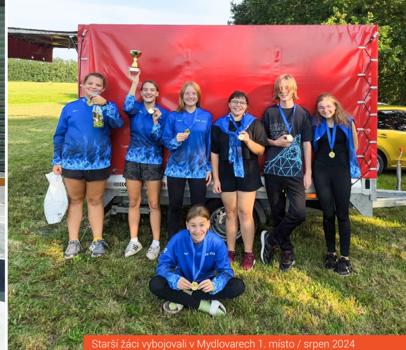
Starší žáci vybojovali v Mydlovarech 1. místo / srpen 2024