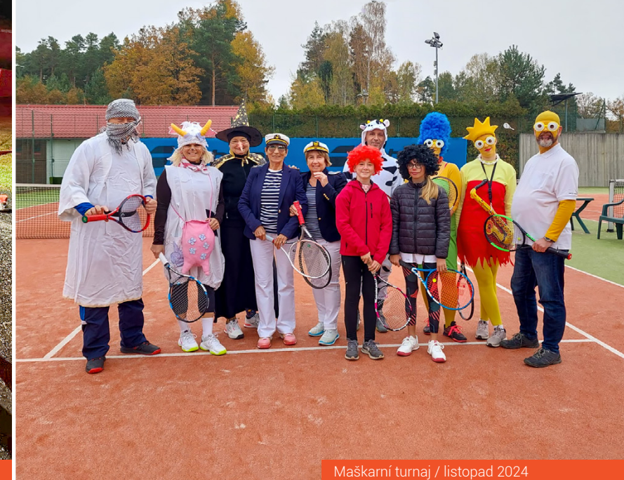
Maškarní turnaj / listopad 2024