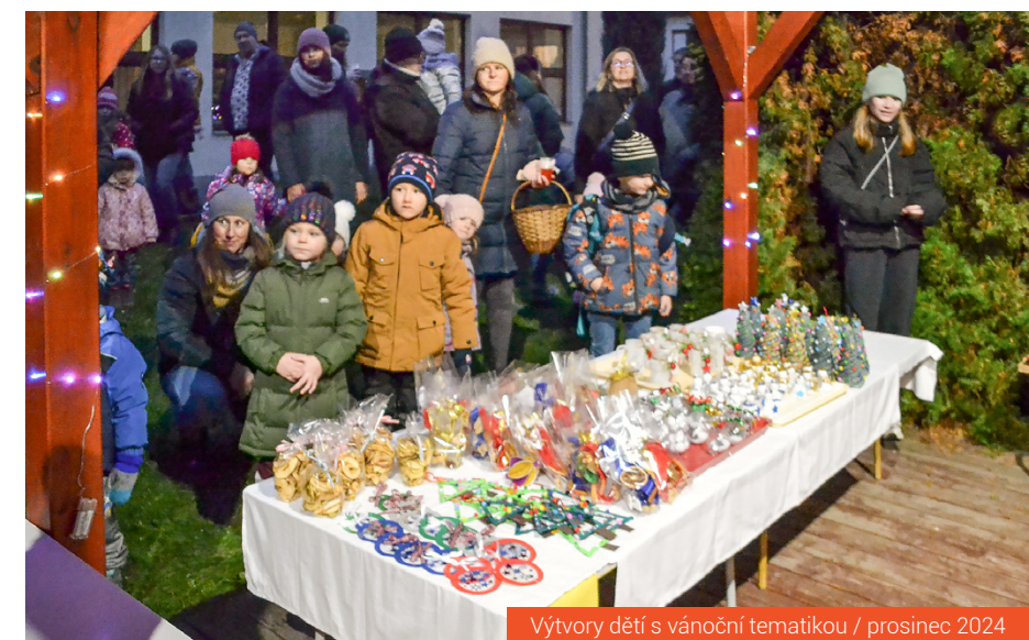
Výtvary dětí s vánoční tematikou / prosinec 2024